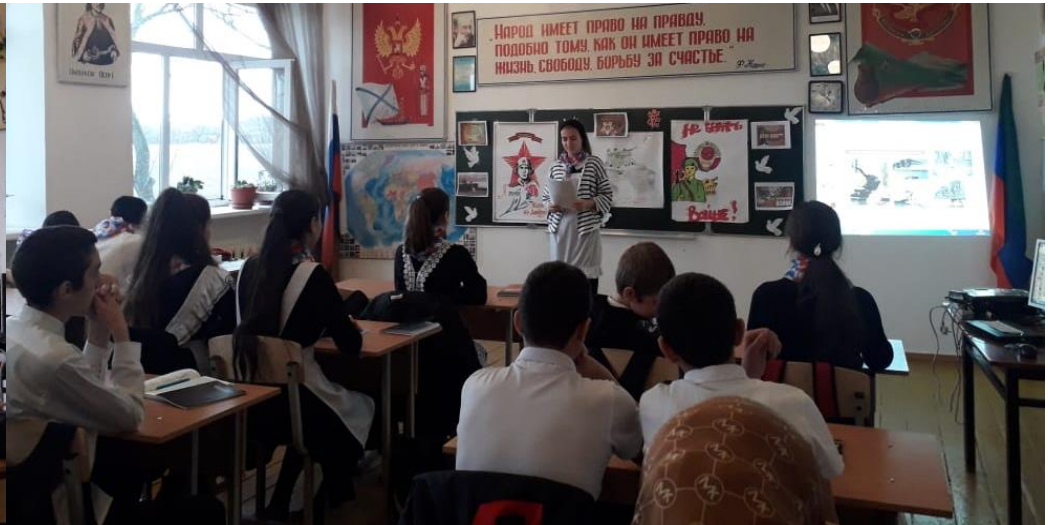
3.12.21гВсероссийский урок Мужества в День Неизвестного солдата