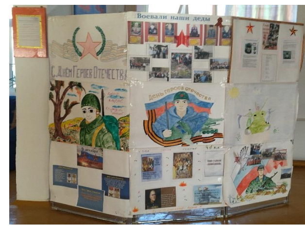
Классные часы к Дню героев Отечества