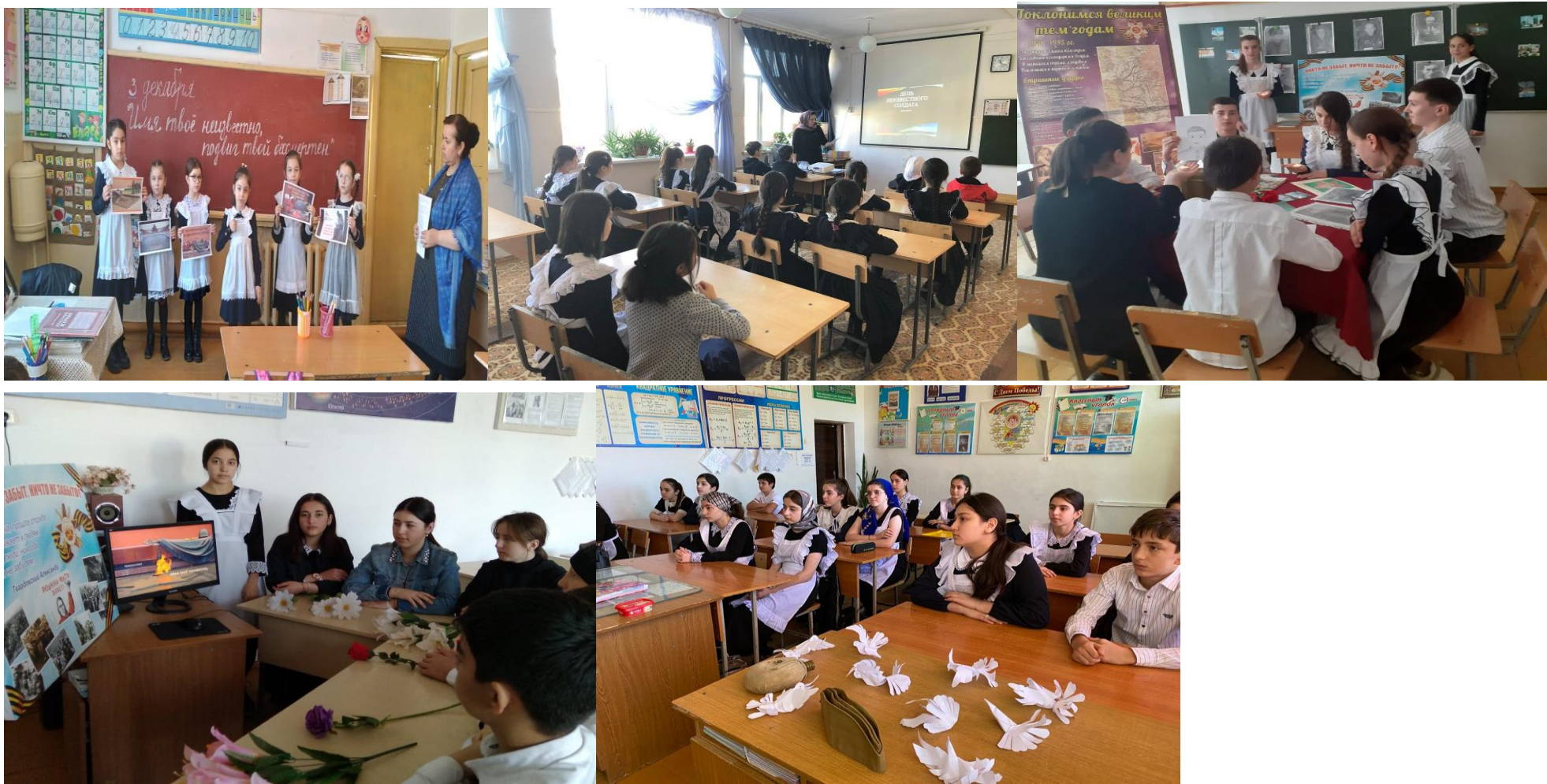
Книжная выставка в школьной библиотеке. Стенд в фойе школы «Имя твое неизвестно. Подвиг твой бессмертен».