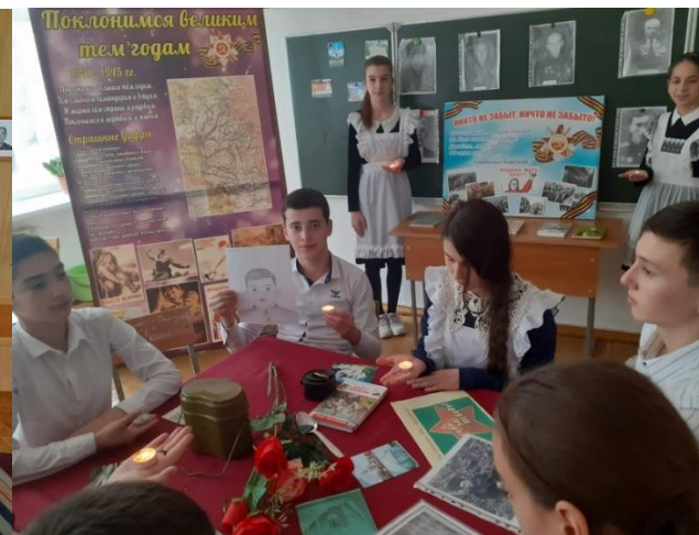
29.10.2021г кл.час на тему: «Поклонимся за тот великий бой»