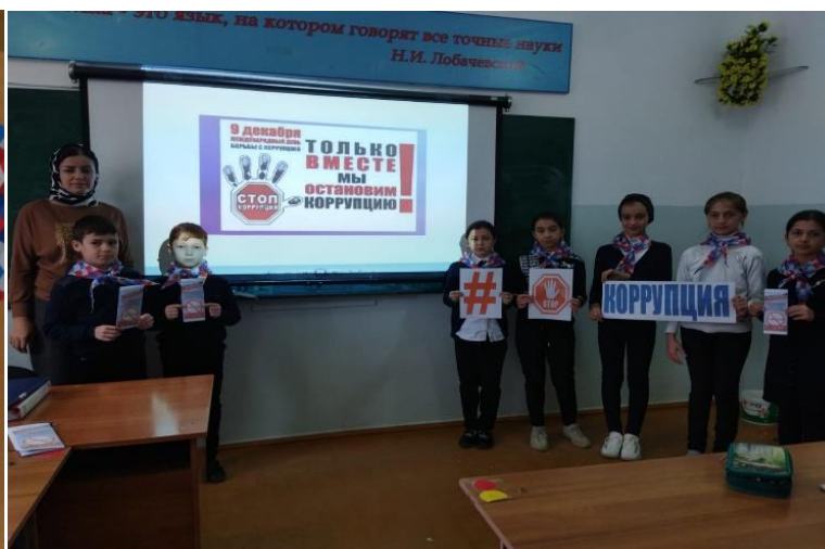
16. 17.12.2021г. классный час на тему «Проступок,правонарушение,преступление» .Охвачено 2045 учащихся