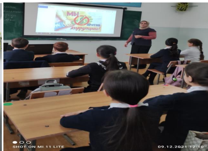
15. 8.12.2021г. куратором РДШ. проведена акция «Стоп,коррупция!».Охвачено 1350 учащихся.