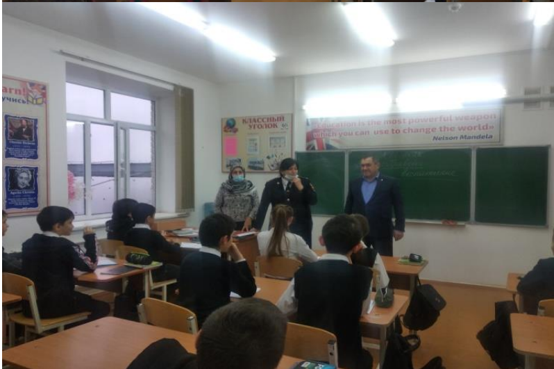
8.12.2021г. беседа с учащимися на тему «Права человека» с приглашением