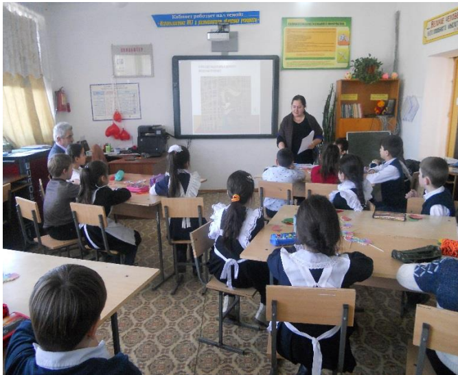
Тема классного часа: «Правду любить – правильно жить»