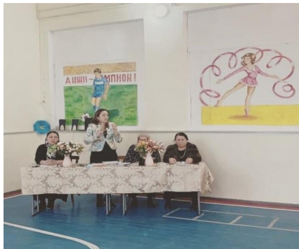
родительское собрание для родителей учащихся 9-11 классов на тему «Помощь семьи в правильном выборе профессии ребенка».