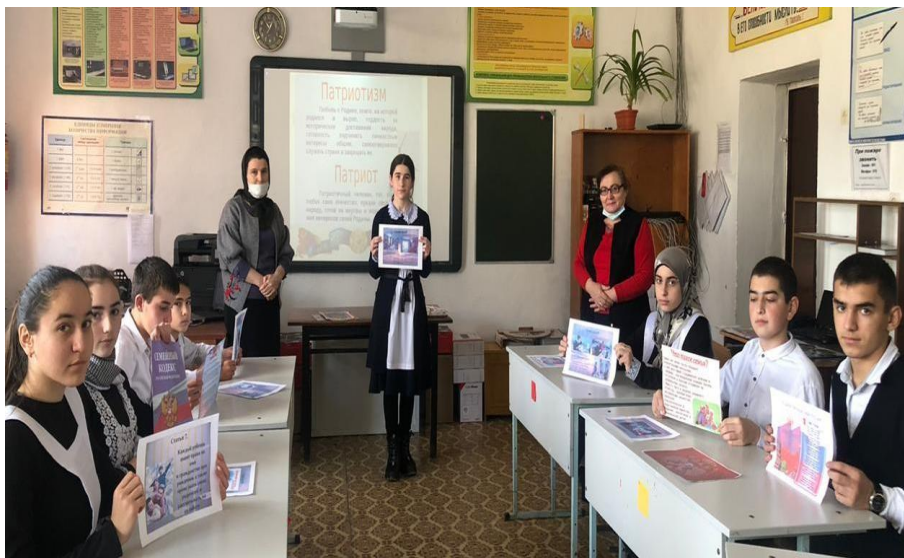
Показ документальных фильмов на военные темы.