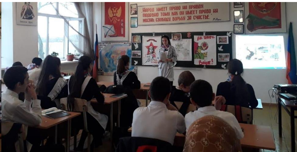
3.12.21гВсероссийский урок Мужества в День Неизвестного солдата