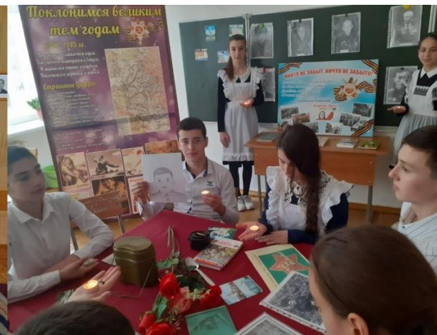
29.10.2021г кл.час на тему: «Поклонимся за тот великий бой»