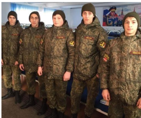
Военные сборы на базе регионального учебно-методического центра военно-патриотического воспитания молодежи «Авангард»