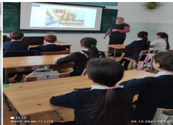
15. 8.12.2021г. куратором РДШ. проведена акция «Стоп,коррупция!».Охвачено 1350 учащихся.