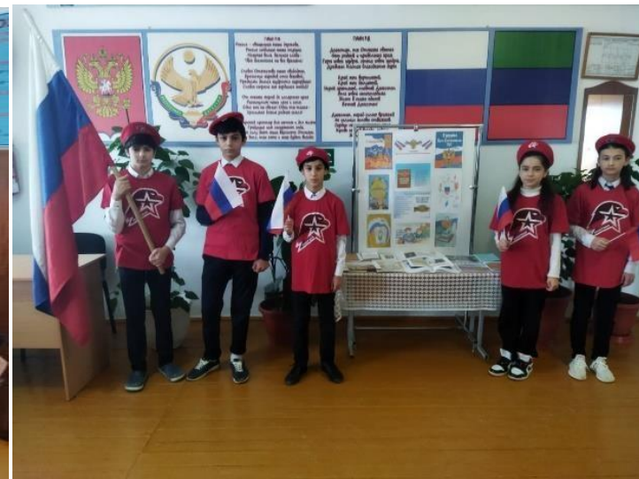
14. С 1 по 9.12.2021г. классные часы ,приуроченные к Международному дню борьбы с коррупцией ,классными руководителями 5-8 классов .(охвачено 4075 учащихся)