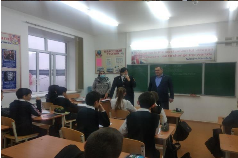
8.12.2021г. беседа с учащимися на тему «Права человека» с приглашением