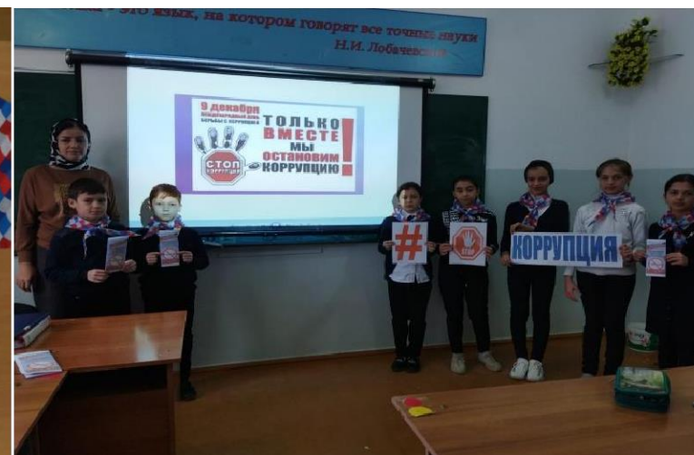
16. 17.12.2021г. классный час на тему «Проступок,правонарушение,преступление» .Охвачено 2045 учащихся