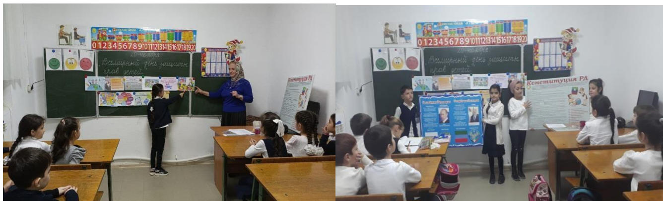
20.11.21. кл.час на тему: «Всемирный день защиты прав детей» 2а, 2б классы