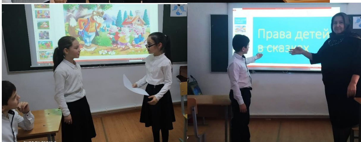
20.11.21. открытое мероприятие на тему: «Я имею право» 4б клас