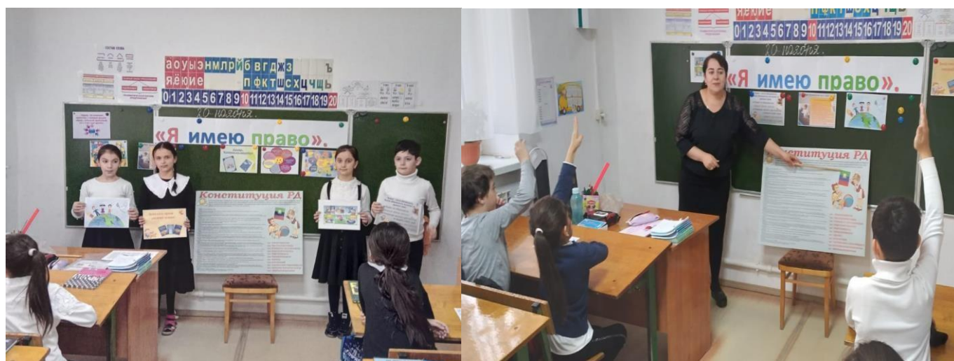
20.11.21г. кл.час на тему: «Я имею право» 4кл.