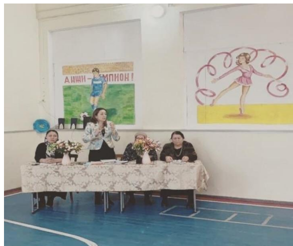
родительское собрание для родителей учащихся 9-11 классов на тему «Помощь семьи в правильном выборе профессии ребенка».