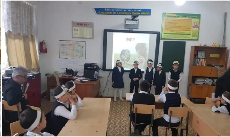
Тема классного часа: