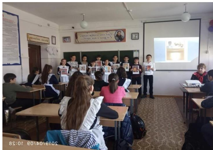
Тема кл. часа: « Правонарушение и наказание ( поступок –проступок-преступление)