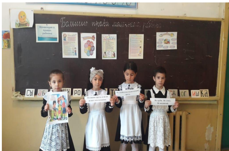
Тема кл. часа: « Права детей - забота государства»

9 - 11 кл. «От безответственности до преступления один шаг»