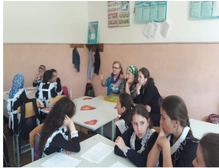
Тема классного часа: «Правду любить – правильно жить» Круглый стол «изучаем свои права», «права человека – твои права»(