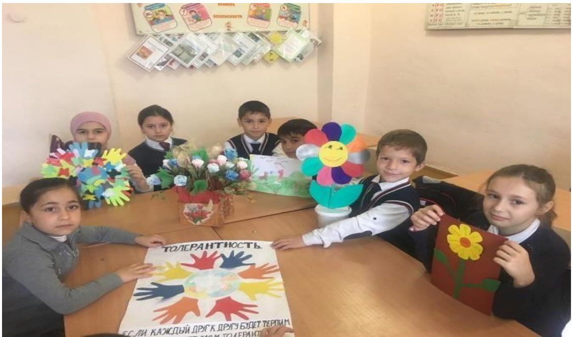
Общешкольное мероприятие с участием родителей «Добро творить чудеса»