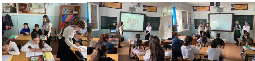
28.04 в школе прошла акция "Возложение цветов". Учащиеся и учителя школ района почтили память односельчан, отдавших жизнь за мир на нашей