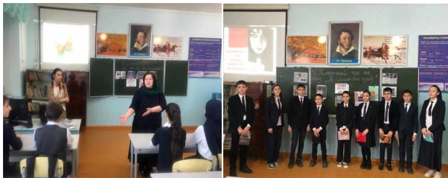
Кл. час в 7а кл. «Наркомания» сломай свою судьбу»

ребенка, развития у подростков осознанного неприятия к вредным привычкам как способ воздействия на свою личности проведены классные часы с уч-ся 7-9 классов.