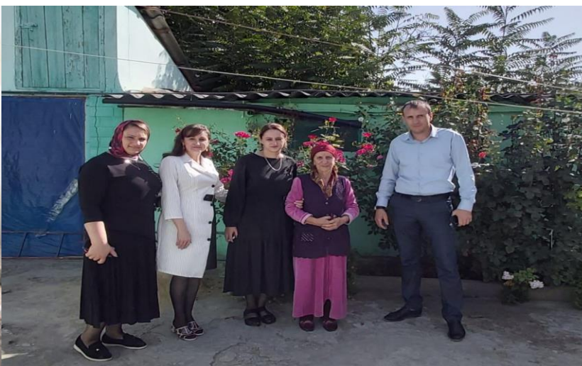
Сотрудники КПП «Буглен» пришли поздравить в школу с Днем учителя.