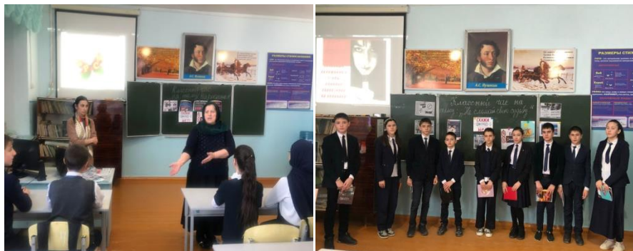
Кл.час в 7а кл. «Наркомания» сломай свою судьбу»

ребенка, развития у подростков осознанного неприятия к вредным привычкам как способ воздействия на свою личности проведены классные часы с уч-ся 7-9 классов.