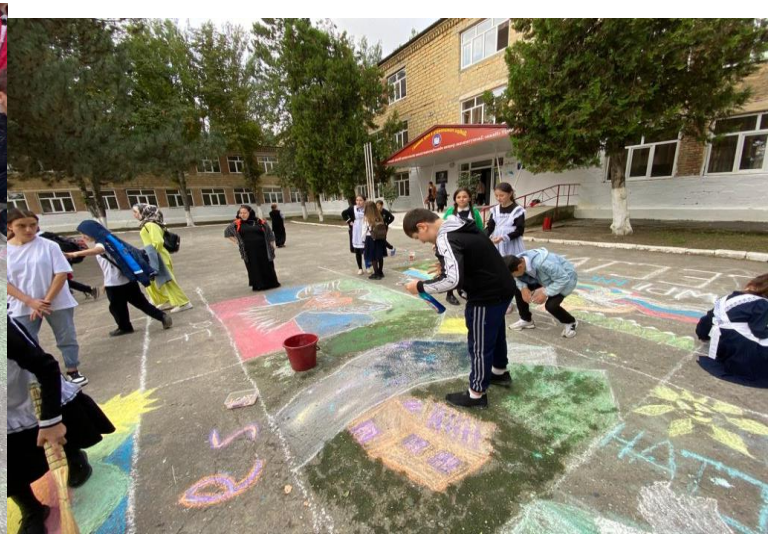
2 «б» кл. Кл.рук.: Атаева З.М.4 «в» кл. Кл.рук.: Гаджиева П.Ш.