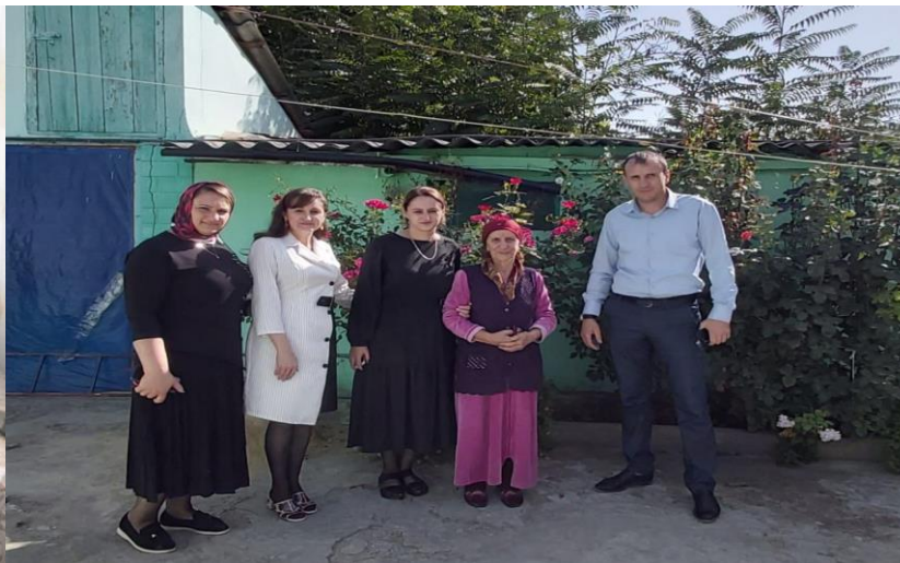
Сотрудники КПП «Буглен» пришли поздравить в школу с Днем учителя.