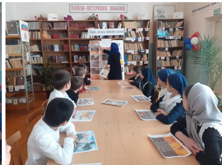
Мероприятия о героизме солдат к празднику 23 февраля.