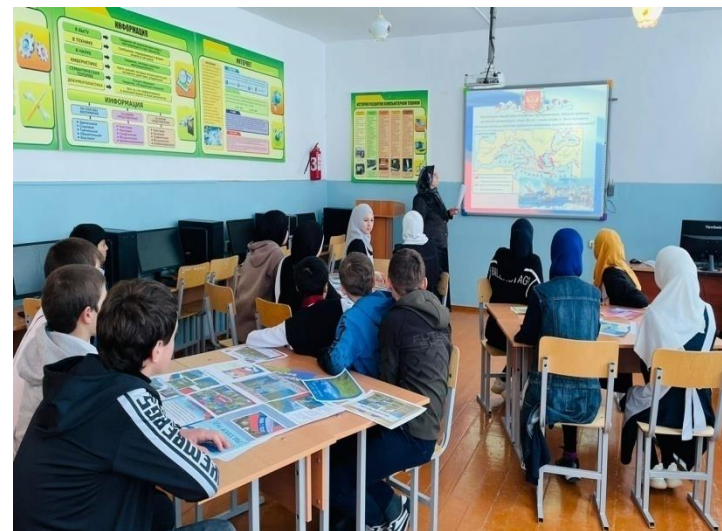
Классные часы посвященные «Дню воинской славы России» 78-годовщине (День снятия блокады г.Ленинграда)