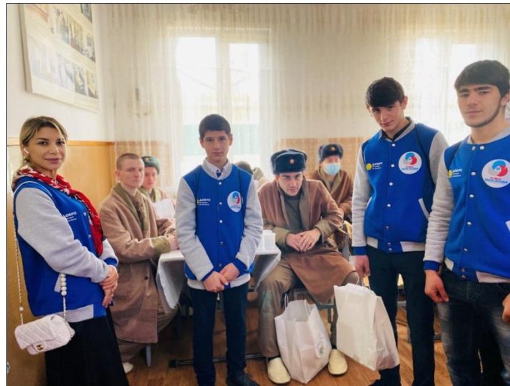
Всероссийская акция посвящённая Дню воссоединения «Крымская лаванда»