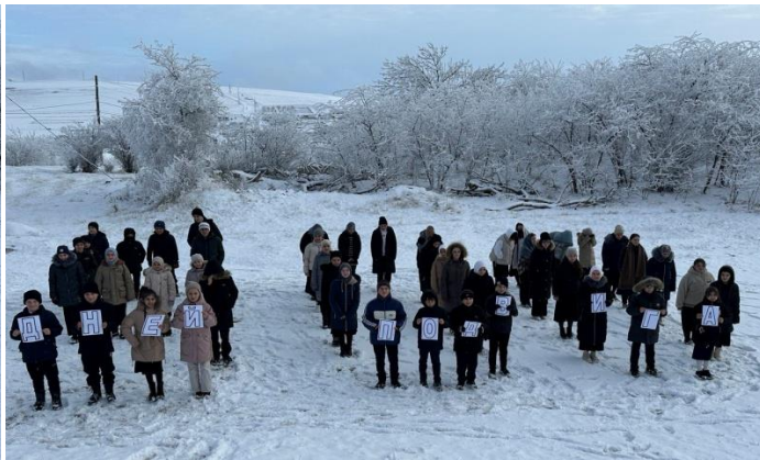
Флешмоб «900 дней подвига»