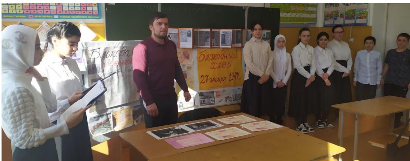
Урок мужества в 7 классе