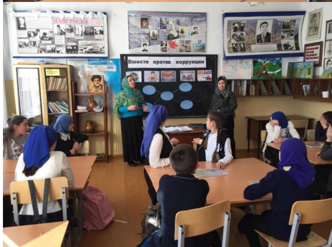
13.12.2019г Классный час в 7 классе, охвачено 10 уч-ся