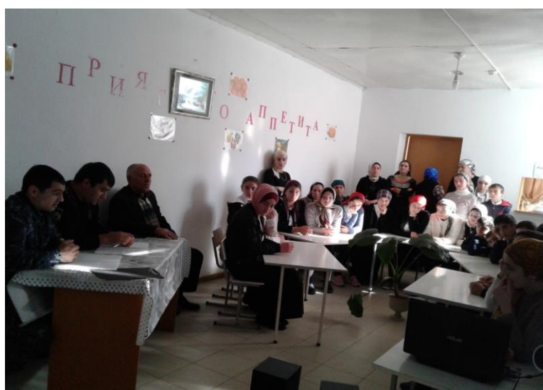
Круглый стол с сотрудниками правоохранительных органов.