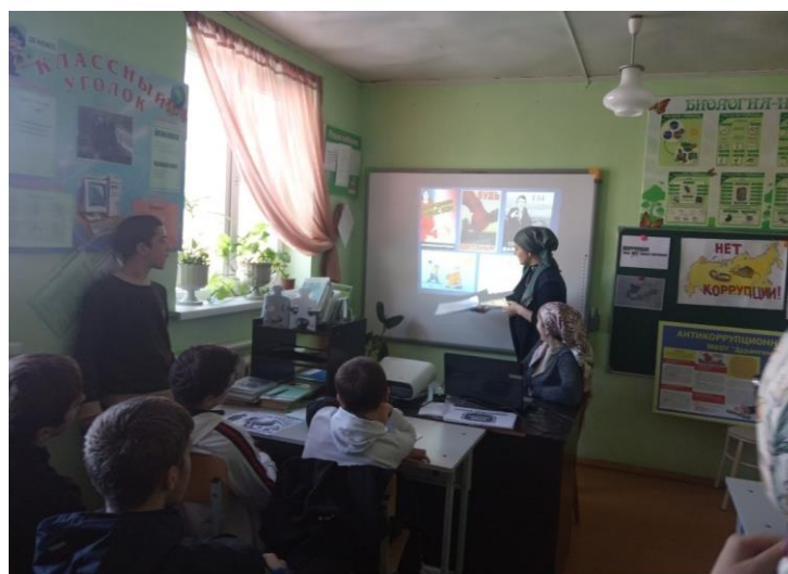
Беседа с учащимися 8- 11 классов на тему: «Нет коррупции». Охват учащихся – 18.