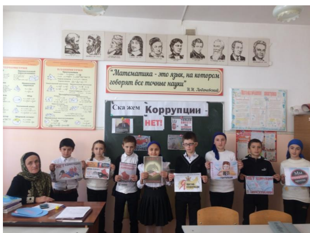
14.12.2019г Классный час в 6 классе, охвачено 10 уч-ся